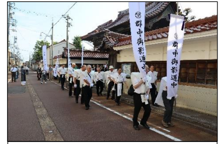
昨年の御影道中の様子