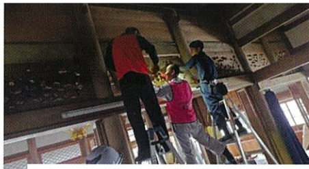
欄間も一つずつ丁寧に外します

能登災害ボランティアのみなさんと合流し、穴水町 西蓮寺様のお手伝いに参加しました。片付けと平行して、中能登町にある親戚寺院様まで仏具を運搬することになりました。片付けていくという事はスッキリした気持ちになります。ご住職さん方のお気持ちを思うと、何とも言えない気持ちになりました。