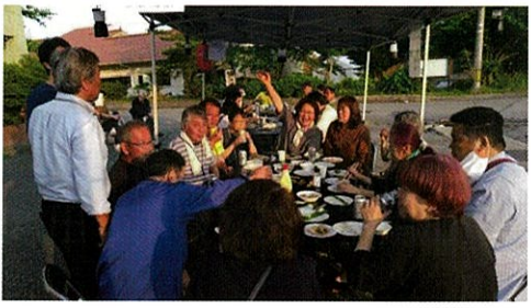
笑顔もこぼれる居酒屋炊き出し

今回のメニューは焼き鳥、厚揚げ、ホタテ、アスパラなどの焼き物や、いぶりがっこチーズなどを用意しました。スズカでの居酒屋は3回目となり、何度も足を運んで下さる方も顔見知りになってきました。