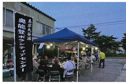
暗くなっても話は尽きません