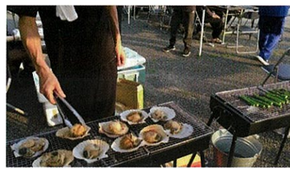
立派なホタテも豪快に

今回のメニューは焼き鳥、厚揚げ、ホタテ、アスパラなどの焼き物や、いぶりがっこチーズなどを用意しました。スズカでの居酒屋は3回目となり、何度も足を運んで下さる方も顔見知りになってきました。