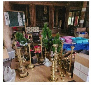
新年の挨拶が貼られたままの黒板。