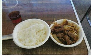
昼食のジンギスカンとご飯

昼食は白ご飯とジンギスカン。夜の居酒屋メニューはいくら丼、アスパラ、パリパリピーマン、ホタテバター、マスのちゃんちゃん焼き、厚揚げ、焼き鳥、エビ汁と多くの料理を用意しました。