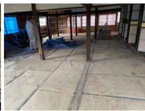
軽トラで計10往復しました

道忍寺様の片付け作業を行いました。壁材や襖、畳を災害ゴミの仮置き場へ搬出しました。片付け作業は人数も多かったのと軽トラ2台で交互に仮置き場まで搬出できたこともあり、予定よりも早く終わることができました。