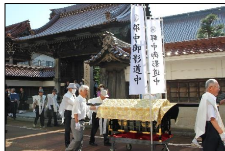
昨年の御影道中の様子