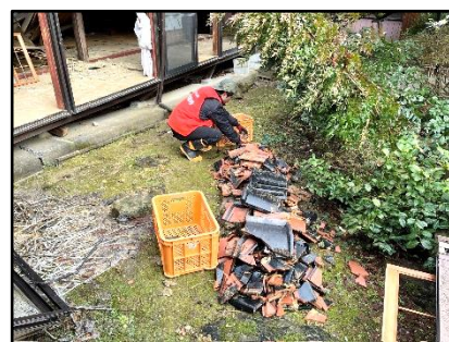
瓦を集める本山職員