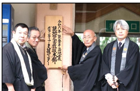
ボランティア支援センター開所式

2月13日現在で50,589,964円の救援金が集まりました。引き続き、皆様からの温かいご支援をお願いいたします。