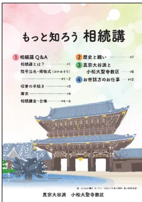
相続講パンフレット（A4版冊子）