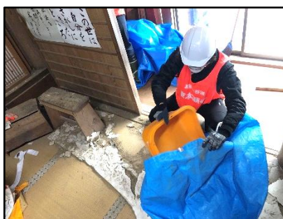
剥がれた内壁の清掃