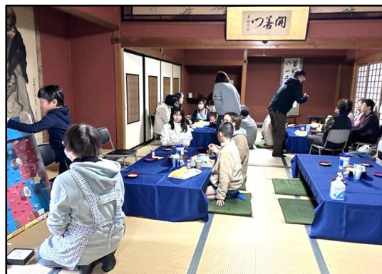
大人から子どもまで約25人が来場

能登から加賀市・小松市などの温泉旅館に2次避難されている方々を対象に、避難所近隣の寺院にて、心落ち着く場を提供しようと、「おてら café」が教区内有志により開催されています。これまでに山代温泉専光寺様にて2回開催されました。今後、第3回は片山津温泉成善寺様（3月2日午後1時30分開催）にて、また、栗津温泉でも開催が企画されています。