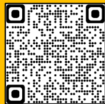
教区ホームページ QRコード

報恩講日程は各組において取りまとめ、教区広報部門委員に掲載作業を行っていただいています。よって、紙面での一覧表は発行いたしませんので、是非とも教区ホームページをご覧くださいご確認いただき、参拝くださいますようお願いいたします。