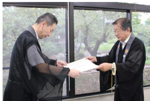
御仏供米進納感謝状受取の様子

合計90キログラムの御仏供米については、11月21日～28日まで厳修される御正忌報恩講に用いられます。御仏供米進納にあたり、ご協力いただいた皆様ありがとうございました。