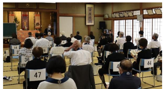
お内仏のお給仕と正信偈の稽古の様子