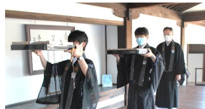
真宗本廟収骨代行の様子

今後の真宗本廟収骨代行本山上山日が下記のとおり決まりましたので、お知らせいたします。