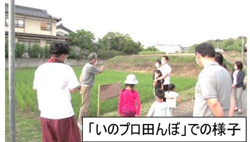
「いのプロ田んぼ」での様子