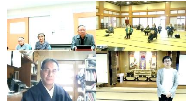
学習会の様子（Web画面）

5月10日に「ハンセン病問題学習会」を開催いたしました。この学習会は、例年、交流研修会として香川の大島青松園へ伺っていましたが、コロナ禍で直接伺うことができなくなったため、せめてWeb上で顔を拝見して交流学习をしたいと企画したものです。