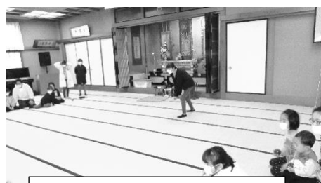
ペタンクで遊びました。